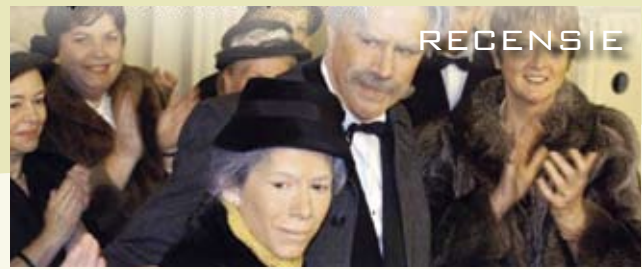
Filmshoot foto's van de cover

Na de oorlog werd hun dochter geboren. Enkele jaren later besloot Albert alleen terug te gaan naar Lambaréné. Zijn vertrek betekende het einde van een normaal gezinsleven. Na de Tweede Wereldoorlog reisde Schweitzer de wereld over om geld in te zamelen voor Lambaréné en ontving hij in 1952 de Nobelprijs voor de Vrede. Toen Hélène overleed, was haar man daar niet bij, maar haar as werd in zijn bijzijn begraven in Lambaréné. Albert overleed in 1965 en liet een ziekenhuis en kliniek voor melaatsen na, die beide tot op de dag van vandaag nog bestaan.